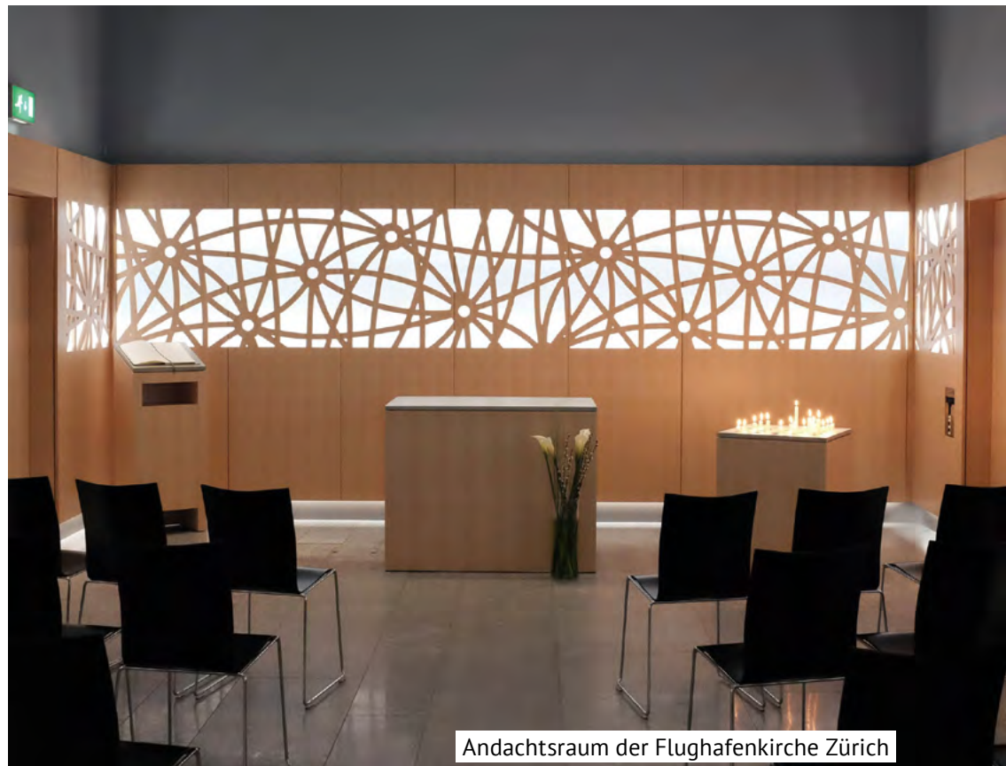
Andachtsraum der Flughafenkirche Zürich

Eine enge Zusammenarbeit besteht mit Polizei, AOZ (Asylzentrum im Transitbereich), Terminal Management und