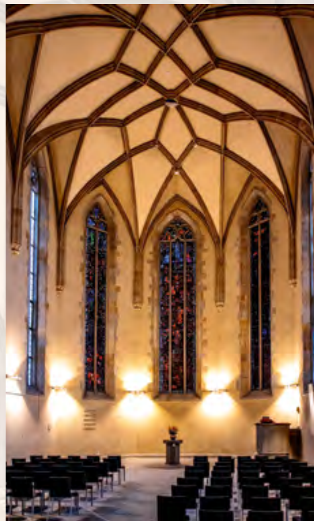
Bild Wasserkirche, Zürich: Werkmeister Hans Felder aus Bayern schuf eine der repräsentativsten spätgotischen Kirchen der Schweiz und hob den städtischen Kirchenbau auf ein neues Niveau, erbaut 1477 bis 1486.